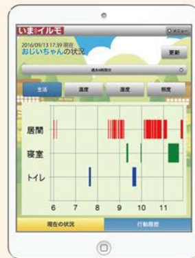
グラフ画面表示の一例 (タブレット)