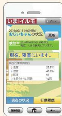
画面表示の一例 (スマホ)